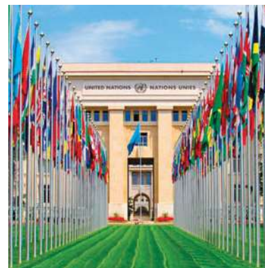
Le Palais des Nations à Genève

Bruxelles, capitale de la Belgique et de l'Union Européenne est une ville très moderne et une ville bilingue. Ses habitants parlent deux langues: le français